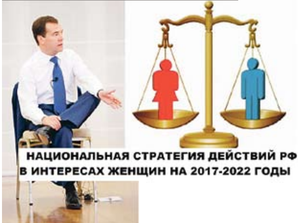
НАЦИОНАЛЬНАЯ СТРАТЕГИЯ ДЕЙСТВИЙ РФ В ИНТЕРЕСАХ ЖЕНЩИН НА 2017-2022 ГОДЫ