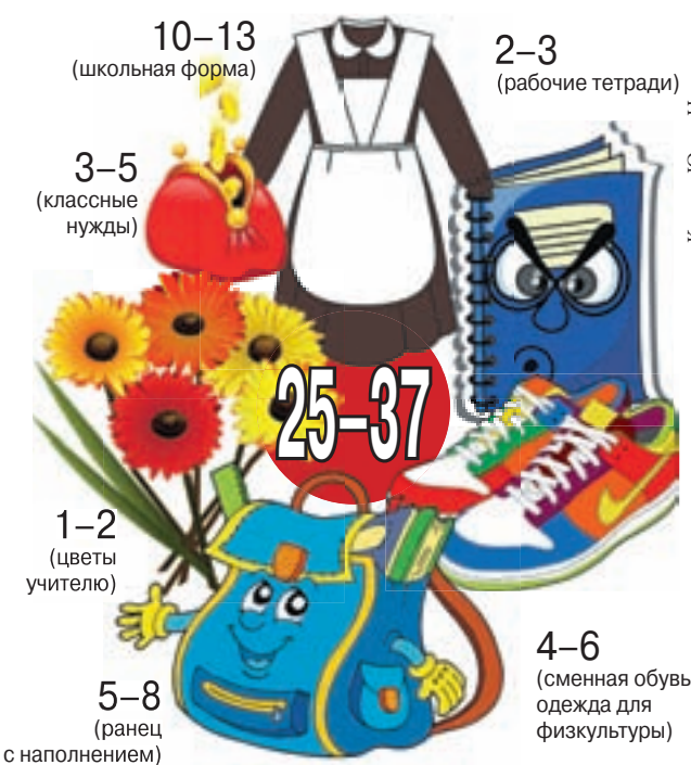
СМЕТА РАСХОДОВ В 2017 ГОДУ (тыс. руб.)